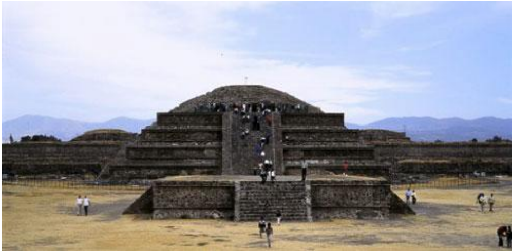
Vue sur le temple de la pyramide de Quetzalcoatl. | Copyright: Domaine public, Altevir Vechia

Le robot "Tlaloc II TC" lui-même, est équipé de caméras et d'un bras manipulateur, avec lequel il peut effacer les obstacles sur le chemin.